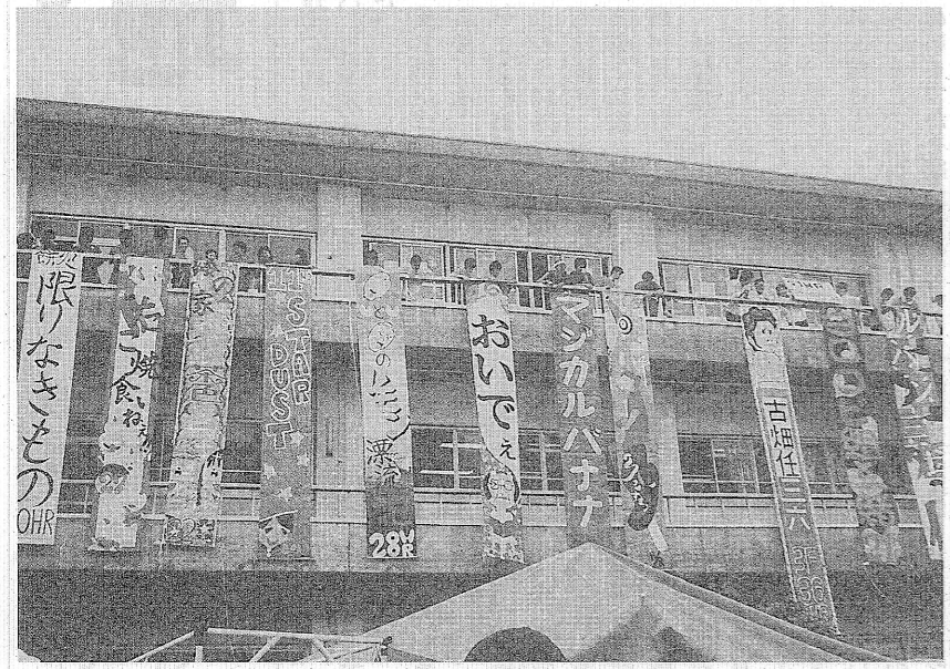
期待の中で一斉に落された垂れ幕

今年の企画 今年度は、昨年度生徒会アンケートに寄せられた意見に基づいて、新しい企画が数多く実施された。 中庭ステージ、空き缶壁画、西空廊下の「波濤祭」の文字、校門装飾、模擬店賞、PR垂れ幕コンテストなどである。(PR、垂れ幕は以前から行われていたが、今回はコンテストも行われた)