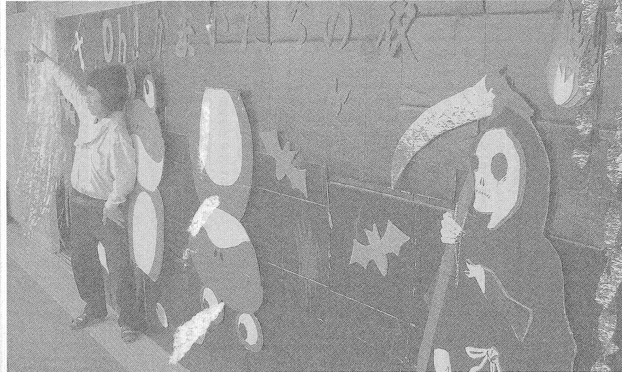
30HRの「OH!! かまいたちの夜」の様子。大波濤祭賞 ★本当におめでとうございます!!