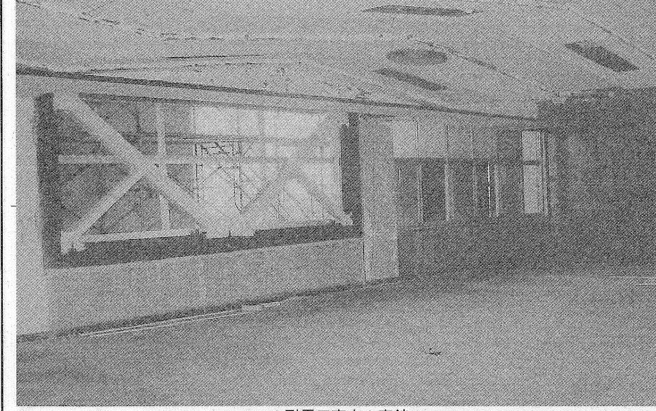
▲耐震工事中の南館

夏休みが近づいてきている今、東海地震もまた近づいてきている。現在、予想できる範囲では、マグニチュード八程度であることに加え、死者や重傷者数は約十万人にも上るといわれる。これら第一次被害想定だけでなく、地震でもよらぬ被害が出る可能性もある。自分の命は自分の手で守る他無い。少しでも確実に準備を行い、東海地震がいつ来ても対応することができている状態であることが最も重要なことである。