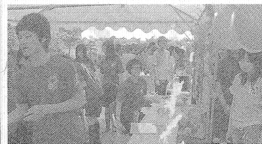
27HR 当日は、大盛り上がりだね!