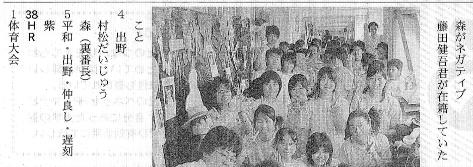
体育大会で優勝した黄組 38HR