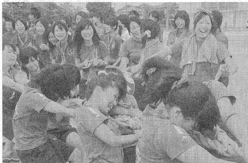
体育大会の綱引きで一致団結して頑張る3年生!

仲間と過ごした青春の日々 今年の春で高校生活を終える3年生の先輩方に思い出に残ったことを聞いてみた。各クラス1人1人全員にアンケートの形で答えてもらった。受験に忙しいなかでもしっかり答えてくれた先輩方に感謝したい。 アンケート 1 高校生活の中で一番思い出に残った行事は? 2 このクラスで起こったハプニングといえは? 3 このクラスの自慢は? 4 このクラスのリーダーといえは誰? 5 このクラスを一言で表すと?