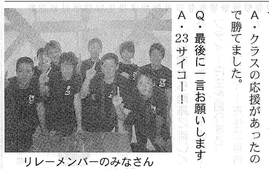
リレーメンバーのみなさん

●最後に一言お願いします A・23サイコー! Q・最後に一言お願いします A・クラスの応援があったので勝てました。