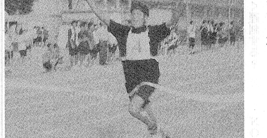
リレーメンバーのみなさん

●最後に一言お願いします A・23サイコー! Q・最後に一言お願いします A・クラスの応援があったので勝てました。