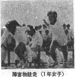
障害物競走(1年女子)

本校水泳大会が、十一月二十五日に本校体育館で開催された。当日は、若さ溢れる選手たちが活躍し、観客も大勢集まった。大会は、各学年の対戦が行われ、一年生は、男子の部で活躍し、女子の部でも健闘をみせた。大会は、十一月二十五日に本校体育館で開催された。当日は、若さ溢れる選手たちが活躍し、観客も大勢集まった。