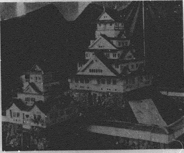
優秀作品 31HR 「城」

十二月一日、本校体育館で、本校生徒による「日本古来の美の探求」文化展が開かれた。当日は、本校生徒の力作が、来賓の先生方、保護者の皆様、本校生、教職員、関係者の皆様、大勢の御来賓により、大変盛況を博した。展示は、本校生徒の力作が、来賓の先生方、保護者の皆様、本校生、教職員、関係者の皆様、大勢の御来賓により、大変盛況を博した。 十二月一日、本校体育館で、本校生徒による「日本古来の美の探求」文化展が開かれた。当日は、本校生徒の力作が、来賓の先生方、保護者の皆様、本校生、教職員、関係者の皆様、大勢の御来賓により、大変盛況を博した。