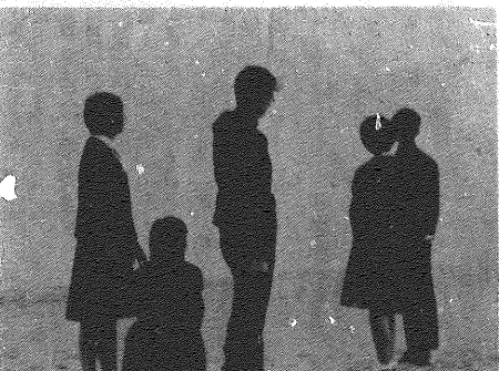
友情は時が実る花である

「本来の教育とは？」という問い。教育は、知識を教えることだけではない。人間性を育て、社会で生きていくための力を教えることである。現実の入試は、知識のテストではなく、人間性のテストである。教育は、人間性を育て、社会で生きていくための力を教えることである。教育は、知識を教えることだけではない。人間性を育て、社会で生きていくための力を教えることである。