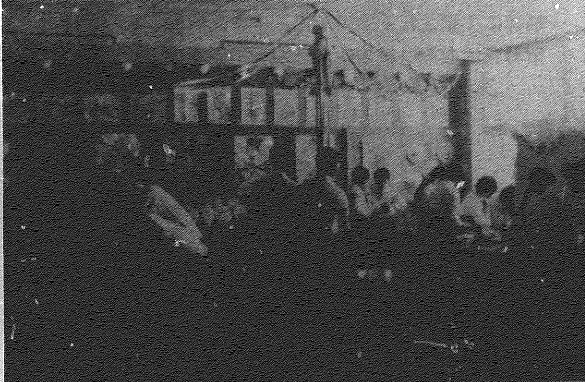
本校文化展も今年で三回目を迎え、クラス展、クラブ展も軌道に乗り始め、また新しくフォークソングが取り入れられた。しかしそこにはマンネリ化が叫ばれ、いくつかの問題が残された。どのような問題があるか、それぞれに反省を聞いてみた。将来、我々の問題である、これらをどう処理するかを今後を期待する。

九月二十日、本校体育大会の閉幕後、第二回の文化展が催された。この文化展は、本校のマンネリ化から脱皮するための重要な行事である。今年度は、マンネリ化を打破し、新しい文化展を目指して行われた。この文化展には、多くの生徒が参加し、それぞれの得意分野を発表した。また、来賓の方々もご来場いただき、本校の文化活動を応援してくださいました。文化展の意義は、単に発表の場を提供することだけでなく、生徒の自主性を伸ばし、創造力を養うことにあります。今後も、このような行事を通じて、本校の文化活動をさらに発展させていきたいと思います。