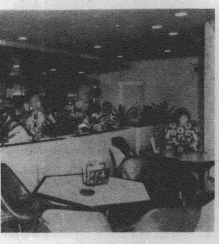
〈問題の多い喫茶店の出入り〉

現在の立場を認識せよ 生徒自身の問題 本校が創立五周年を迎えるにあたり、五周年記念行事が盛況を博した。この五周年記念行事は、本校の歴史を振り返り、現在の立場を認識し、今後の発展を期すための重要な機会であった。生徒自身は、この機会を通じて、自身の成長と進歩を自覚し、より一層の努力を怠らぬことを誓った。また、教職員も、この五周年を契機として、教育の質を向上させ、生徒の将来に貢献する決意を新たにした。