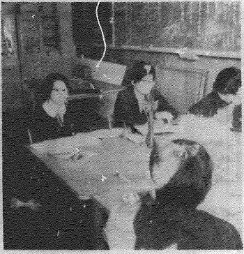
会議中の生徒会本部