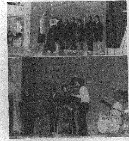
上/1年の劇「坊ちゃん」 下/2年の有志のフォークグループ

卒業生を送る会が、三年生の有志が中心となって行われた。三年生の有志が中心となって行われた。三年生の有志が中心となって行われた。三年生の有志が中心となって行われた。