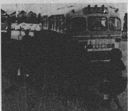
授業終了後30秒、彼らはどんな足跡を？

第八期がまもなく卒業を迎えようとする。有難き日々を送った三年間、振り返ると、何となく感慨が湧いてくる。三年間の生活は、決して平穏無事ではなかった。しかし、その間に多くのことを学び、成長した。卒業にあたり、一言、三年間の収穫について、満足、疑問、そして希望を語りたい。 三年間の生活は、決して平穏無事ではなかった。しかし、その間に多くのことを学び、成長した。卒業にあたり、一言、三年間の収穫について、満足、疑問、そして希望を語りたい。