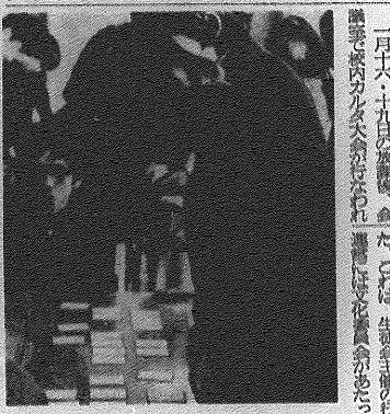
熱戦が続くカルタ大会

本校でカルタ大会が開催された。接戦が続いたが、本校が優勝した。これは、選手たちの努力とチームワークの結果である。優勝を喜び、今後の活動に励むこととなる。