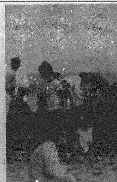
砂の芸術に取り組む

●浜辺で芸術展 浜辺で芸術展は、浜辺の風景をテーマにした芸術展です。ここでは、浜辺の風景をテーマにした芸術展を開催しています。 ●少し肌寒かった砂浜 少し肌寒かった砂浜は、浜辺の風景をテーマにした芸術展です。ここでは、浜辺の風景をテーマにした芸術展を開催しています。