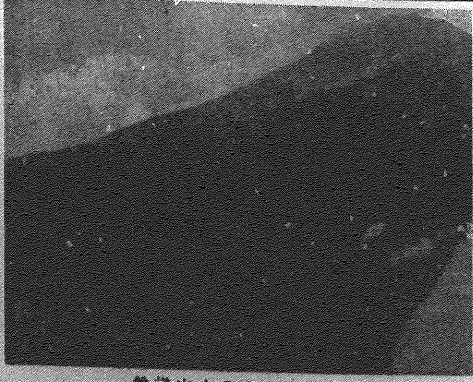
富士山とのどかな牧場

本校の東北旅行は、例年通り、且、豪華、華やかで、多くの来場者で賑わった。中でも、今年の特集は、各学年が制作した文化展のポスター、フィナーレ参加者の作品などが、会場を彩った。また、会場には、多くの来場者が、文化展のポスター、フィナーレ参加者の作品などを、手に取り、会場を賑わせた。