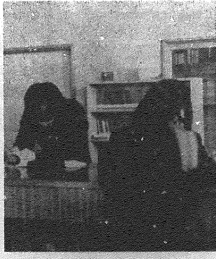
図書委員会の活動の様子

●委員会同好会便り 委員会同好会は、本校の発展に貢献するため、各委員会・同好会が自主的に活動する体制をとっています。その活動内容は、多岐にわたります。 ●放送委員会 放送委員会は、本校の広報活動に努めています。毎週放送する「南高放送」は、生徒の生活や学校行事を詳しく伝えています。 ●図書委員会 図書委員会は、読書の奨励と図書室の充実を目指しています。毎月「読書週間」を開催し、読書会や読書感想文コンクールを行います。 ●音楽委員会 音楽委員会は、音楽の普及と演奏力の向上を目指しています。毎週「音楽会」を開催し、生徒の演奏を聴かせます。 ●体育委員会 体育委員会は、生徒の体育活動を支援しています。毎週「体育大会」を開催し、生徒の活躍を応援します。 ●美術委員会 美術委員会は、美術の普及と創作力の向上を目指しています。毎月「美術展」を開催し、生徒の作品を展示します。 ●英語委員会 英語委員会は、英語の学習を支援しています。毎月「英語講座」を開催し、英語の勉強をサポートします。 ●保健委員会 保健委員会は、生徒の健康増進と生活習慣の改善を目指しています。毎月「健康講座」を開催し、健康の大切さを伝えます。 ●生活委員会 生活委員会は、生徒の生活指導と生活習慣の改善を目指しています。毎月「生活講座」を開催し、生活の知恵を伝えます。 ●自治会 自治会は、本校の自治活動を行います。毎月「自治会活動」を開催し、生徒の自治意識を育てます。