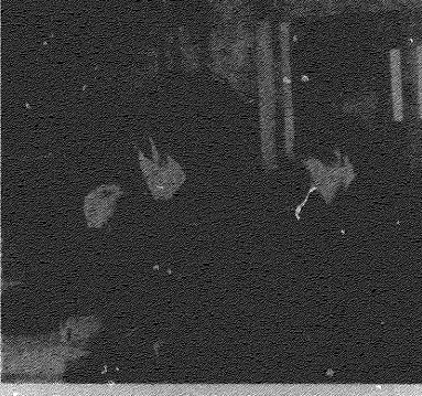
授業を受ける生徒たち

授業の進め方と先生の態度は、生徒の学習意欲に大きく影響する。授業の進め方が単調で面白くないと、生徒は授業に集中できず、学習効果が低下する。また、先生の態度が一方的で生徒の意見を聞かないと、生徒は授業に参加できず、学習意欲が低下する。したがって、授業の進め方を工夫し、先生の態度を改善することは、生徒の学習意欲を高めるために不可欠である。授業の進め方を工夫するには、生徒の興味や関心を引き出すような授業内容を選ぶことが重要である。また、先生の態度を改善するには、生徒の意見を積極的に聞き取り、授業に反映させることが重要である。