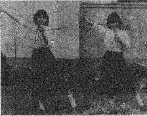
若水 発散、巨気持ち!!

去る六月二十七日、二十八年の歴史と功業の輝きにちなんで、本校の創立七十周年記念として、本校の歴史を振り返り、未来への展望を語り、文化の発展を期すべく、本校創立七十周年記念文化展を開催した。