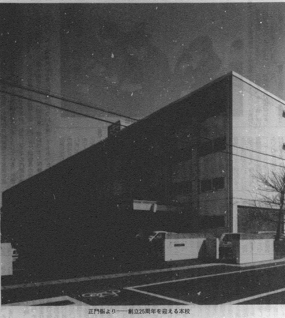
正門前より——創立25周年を迎える本校

昭和三十八年四月三日米津の地を拓き、ここに本校が誕生した。この二十五年の歩みは、決して平坦な道ではなかった。戦後、教育の復興と共に、本校もまたその歩みを進めてきた。この二十五年の歩みは、決して平坦な道ではなかった。戦後、教育の復興と共に、本校もまたその歩みを進めてきた。この二十五年の歩みは、決して平坦な道ではなかった。戦後、教育の復興と共に、本校もまたその歩みを進めてきた。 昭和三十八年四月三日米津の地を拓き、ここに本校が誕生した。この二十五年の歩みは、決して平坦な道ではなかった。戦後、教育の復興と共に、本校もまたその歩みを進めてきた。この二十五年の歩みは、決して平坦な道ではなかった。戦後、教育の復興と共に、本校もまたその歩みを進めてきた。この二十五年の歩みは、決して平坦な道ではなかった。戦後、教育の復興と共に、本校もまたその歩みを進めてきた。